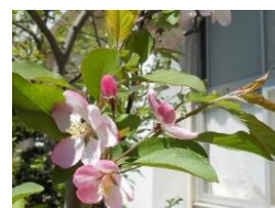
保健室前のかいどう