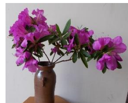
光輪花(こうりんか)サークル